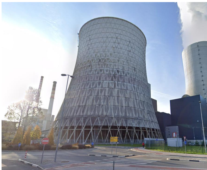
Skica 2: fotografija HSB4.

Zemljišče v lasti TEŠ (ID znak: parcela 959 1227), ki je predvideno za najem, se nahaja znotraj energetske lokacije TEŠ. Namenska raba zemljišča opredeljuje, da se parcela 959 1227 nahaja na območju energetske infrastrukture (E).